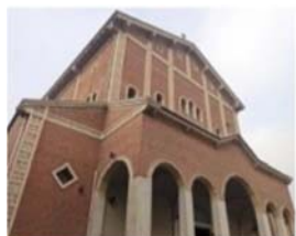
Santa Maria Beltrade