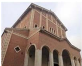
Santa Maria Beltrade