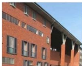
San Gabriele Arcangelo